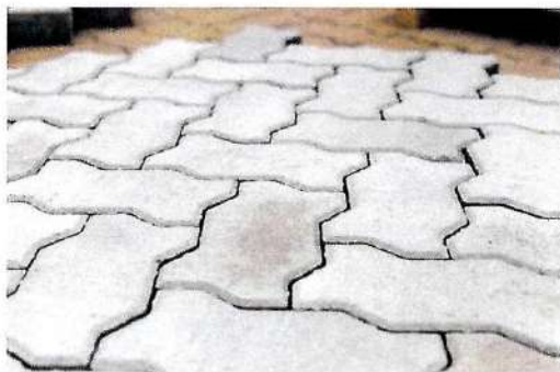
Скамья (3 штуки)