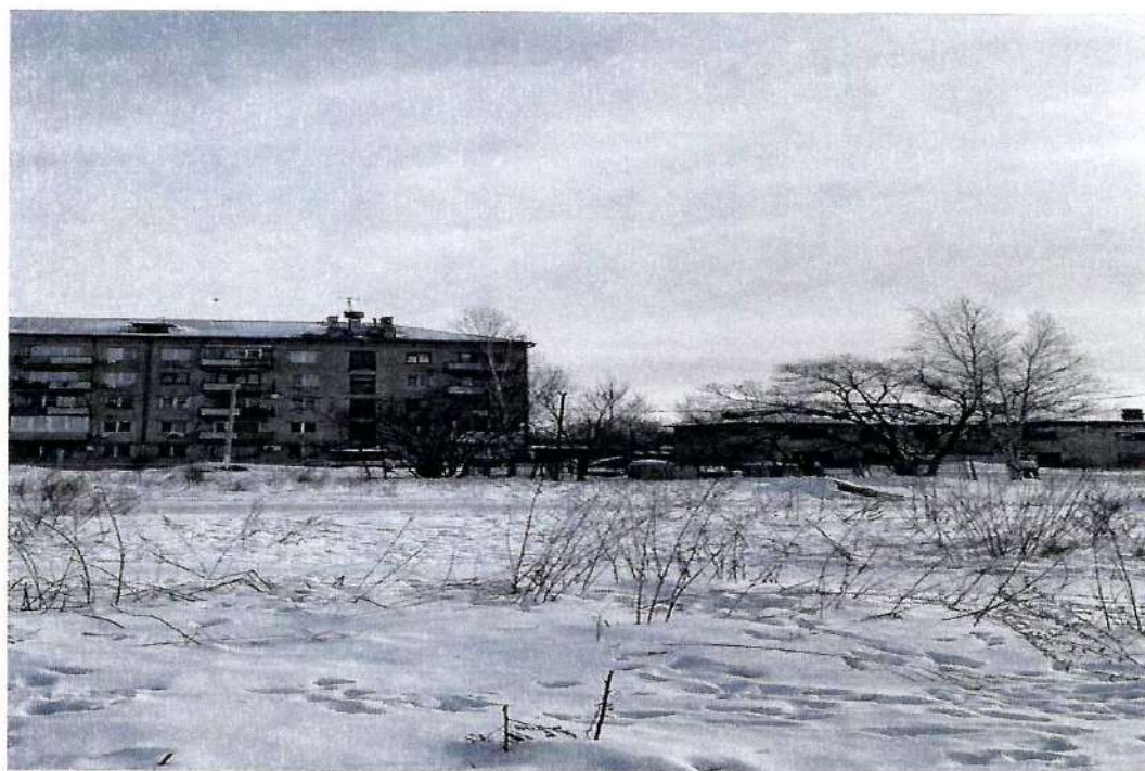
Фото территории в настоящее время