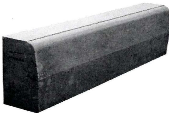
Бордюр дорожный БР-300-30-15