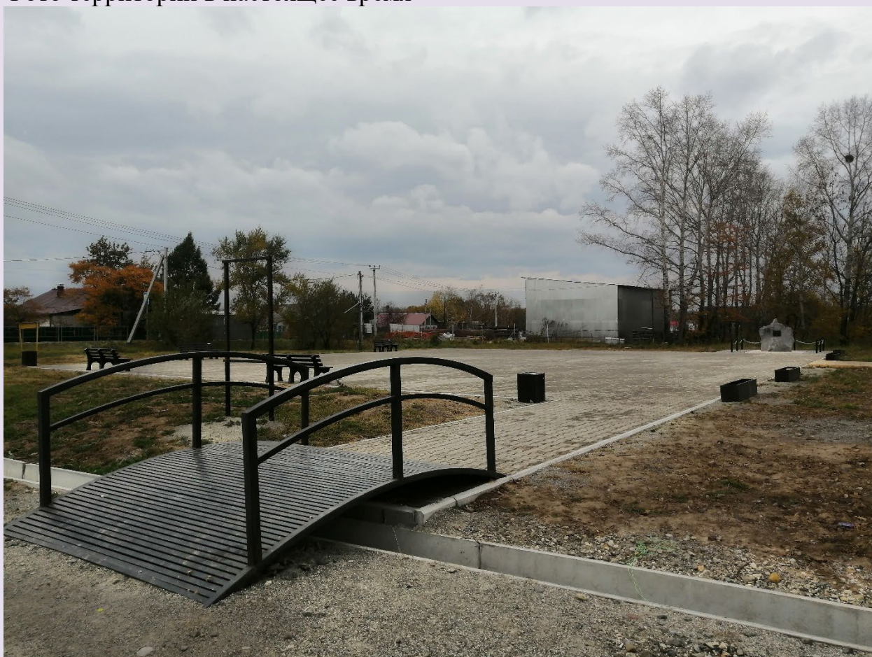
Фото территории в настоящее время