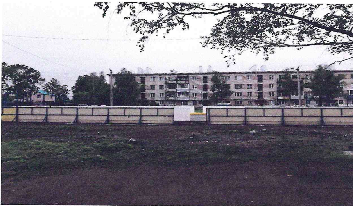
Фото территории в настоящее время