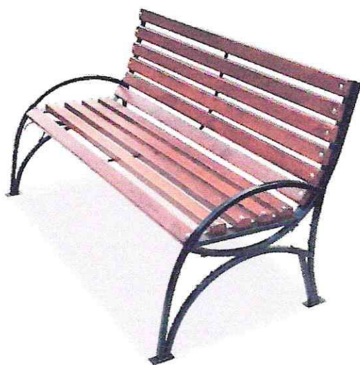
Скамья (4 штук)

Скамья металлическая из металлического профиля, окрашенного полимерной краской черного цвета. Брус на скамейку изготовлен из хвойных пород древесины, окрашен и обработан антисептиками и тонирующими пропитками.