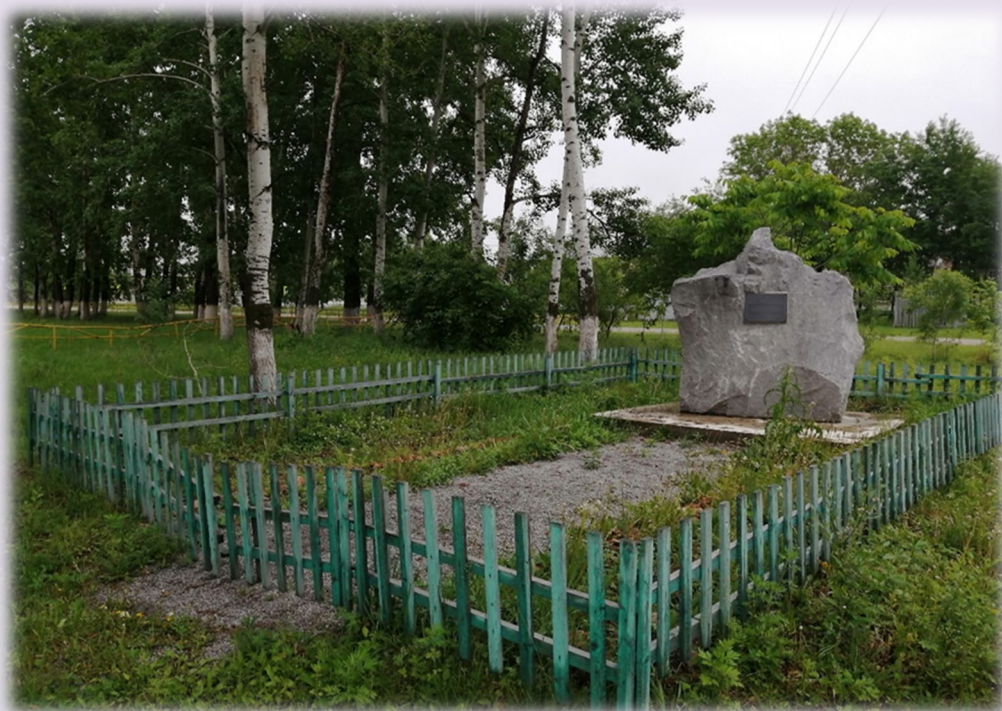
Фото территории в настоящее время