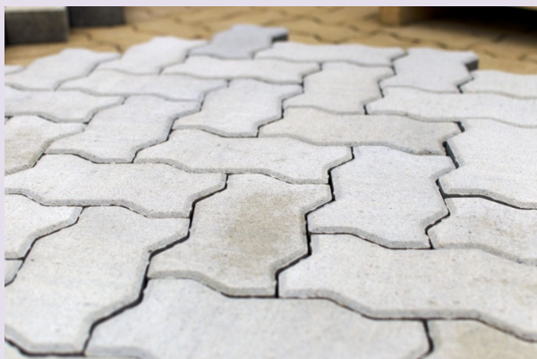
Брусчатка (приблизительно 145 м 2 )

Брусчатка гладкая Вид: волна, кирпичик, катушка Цвет: серый Материал : Бетонная. Размер: 245x132x60 мм