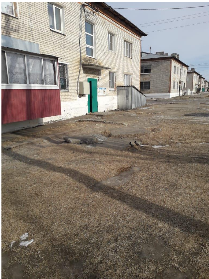
Фото территории в настоящее время

На придомовом участке дома № 41, по ул. Центральная, разрушен асфальт. В данное время необходимо восстановление придомовой территории размером 167,48м 2 .