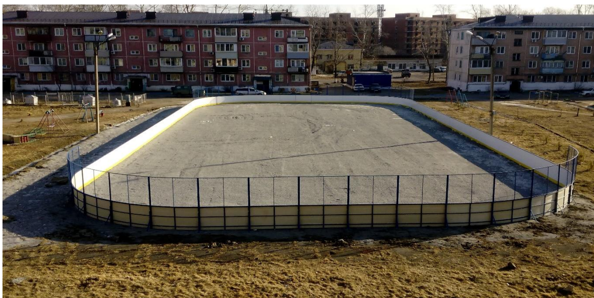
Фото территории в настоящее время