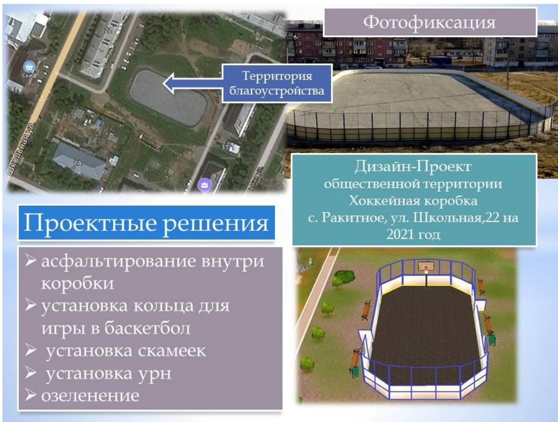
Дизайн-проект благоустройства общественной территории Хоккейная коробка с. Ракитное, ул. Школьная, 22 на 2021 год