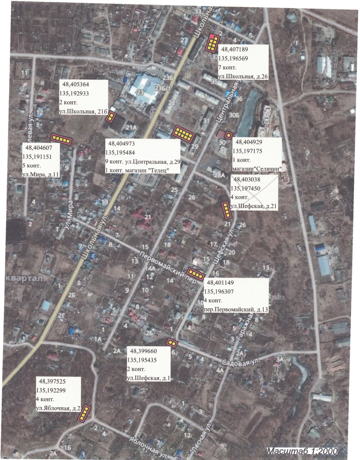
Схема вывоза ТБО и КГМ многоквартирных домов в с.Ракитное